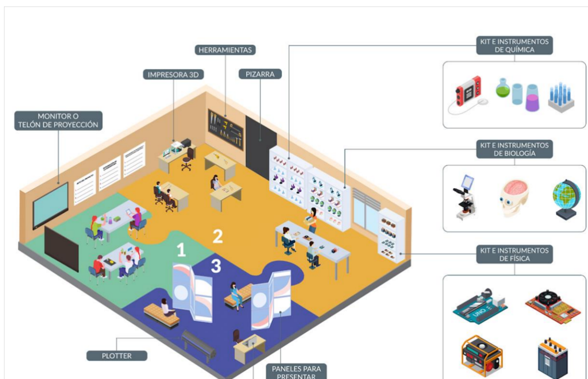
Figura N°2 Laboratorio STEAM