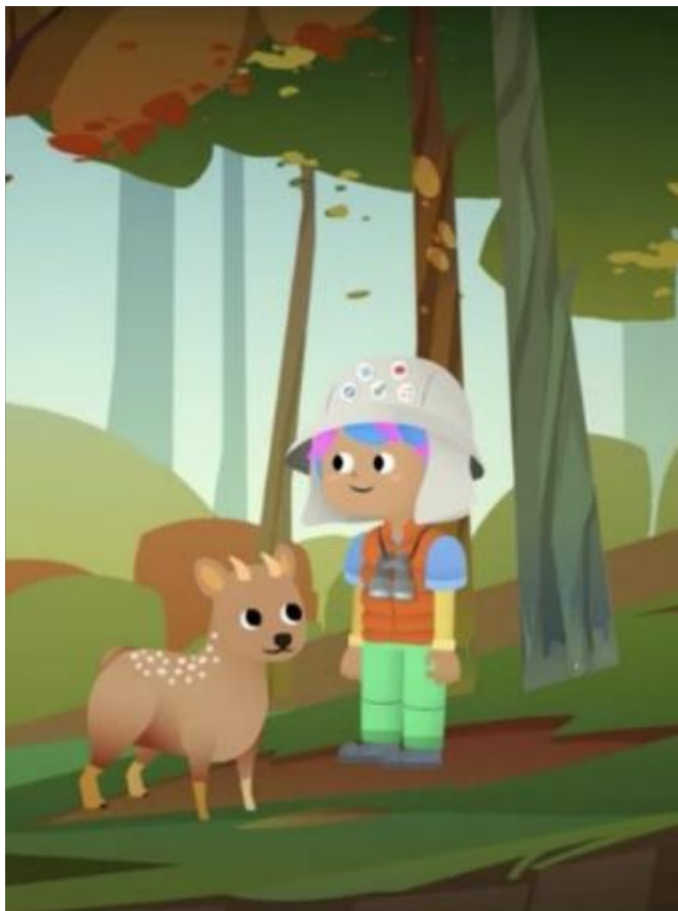
Imagen N°1 Dani y Trueno