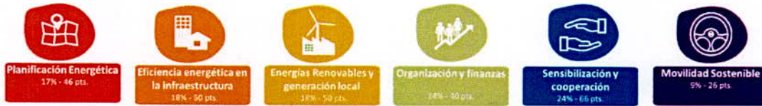
Figura 1. Categorías del Sello Comuna Energética